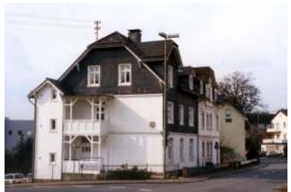
In der Vennstraße 14 hatte die FeG Waldbröl ihren ersten Versammlungsraum.