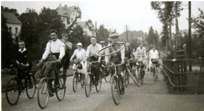
Der Jugendbund 1927 unterwegs zur Freusburg

1921 hatte sich ein Jugendbund der Freien evangelischen Gemeinde Waldbröl gegründet. Von seinen Aktivitäten zeugt ein umfangreiches, gut erhaltenes Protokollbuch mit zahlreichen Bildern. Mitte der 20er Jahre wurde es an der Vennstraße eng. Neue Räume wurden gesucht aber zunächst nicht gefunden. Persönliche Konflikte und politische Gegensätze Mitte der 30er Jahre ließen die Gemeinde dann allerdings schrumpfen. Dass es dabei um die Stellung zum Nationalsozialismus ging, lässt sich unschwer erahnen. Belege gibt es dafür bislang nicht.