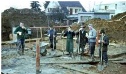
Jede Menge helfende Hände auch beim Bau des Pastorenhauses.