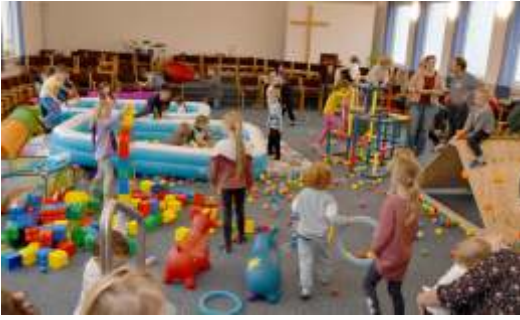
Der Indoor-Spielplatz startete 2023.

sonntäglichen Liveübertragungen der Gottesdienste. Unseren Wunsch, mit einem neuen Pastor die Jugendarbeit zu beleben, mussten wir aufschieben.