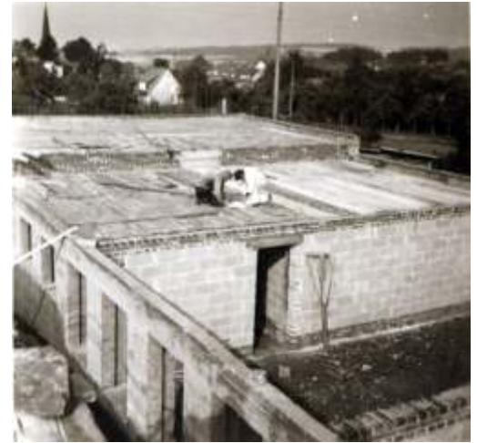
Viel Eigenarbeit prägte den Bau des Gemeindehauses.